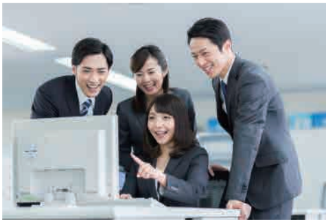
実務で役立つPCスキル