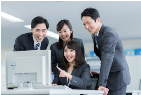
実務で役立つPCスキル